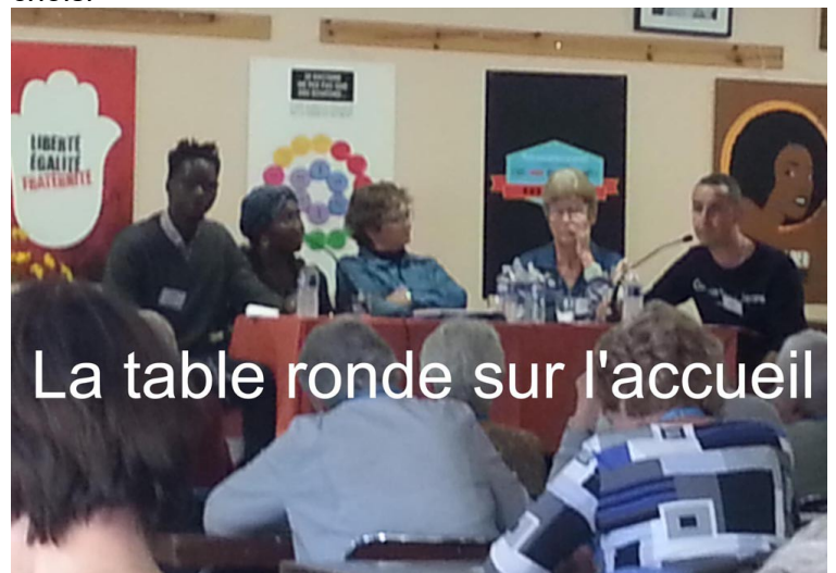
La table ronde sur l'accueil

L'EAL pense que l'engagement doit rester individuel et choisi